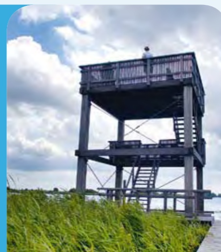
Vogelkijkhut bij het Burgumer Mar

Kijk voor meer informatie op www.friesemeren.nl