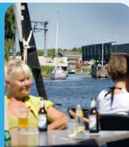
Mensen op terras bij Spoorbrug Akkrum

Fryslân beleeft je echt! Wat al eeuwenlang wordt beweerd, is waar: Fryslân is anders. U bent van harte welkom om het eigen karakter van de provincie te ontdekken. Want Fryslân moet je beleven. En wel in het écht! Hou je van water, dan kom je naar Fryslân De wind in de zeilen. De zon aan de hemel. Een perfecte dag op de Friese meren. Fryslân heeft namelijk het grootste aaneengesloten watergebied aan binnenmeren in Europa. De manier om de provincie te verkennen, is vanaf het water! Geniet onderweg van karakteristieke dorpen en steden met uitstekende faciliteiten. Een bezoek aan Fryslân maakt u hoe dan ook een beetje watersportliefhebber. Kijk voor meer informatie op www.beleeFriesland.nl/watersport Loop even binnen bij de VV De Friese wereld gaat voor u open. Informatie over stads- en dorpswandelingen, rondleidingen, toeristische kaarten, bezienstadsverhuur en tips om lekker te gaan eten, krijgt u bij de VV. Kijk voor meer informatie op www.beleeFriesland.nl/vv en zoek naar de dichtstbijzijnde VV. Grenzeloos varen Het Friese Merenproject van de provincie Fryslân zorgt voor betere vaarmogelijkheden, meer recreatieve voorzieningen en pakt de knelpunten in water- en wegverkeer aan. Zo kunt u kiezen voor meer vaarroutes en genieten van een groter vaargebied. www.beleeFriesland.nl